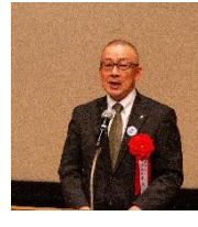
ご来賓の挨拶 (山口知事、坂井市長、江里口市長)