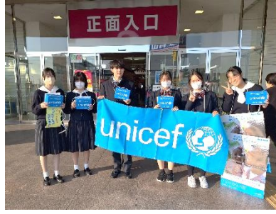
【12月7日(土)ゆめタウン佐賀店 2回目】 募金額 ¥11,171 円