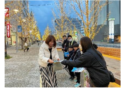
【12月21日(土)浄土真宗本願寺派佐賀教区少年連盟】募金額¥103,199 円