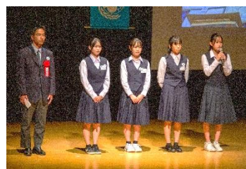
佐賀市内の高校生の皆さん 「やってみよう切手整理ボランティアに参加して」