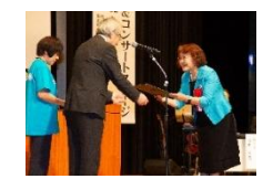
国際ソロプチミスト 佐賀西部