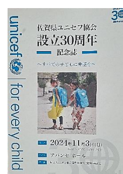
【30周年リーフレット】 【30周年記念誌】