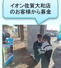
イオン佐賀大和店のお客様から募金