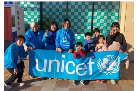
【12月8日(日)モラージュ佐賀店】 募金額 ¥19,500 円