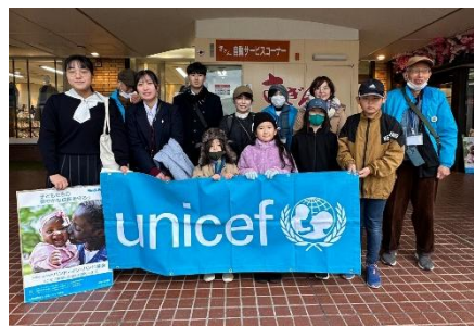
【12月15日(日)佐賀玉屋】 募金額 ¥32,908 円