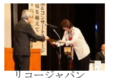
リコージャパン 株式会社佐賀支社