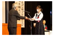
佐賀清和高校 インターアクト部