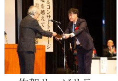
佐賀リハビリテーション病院