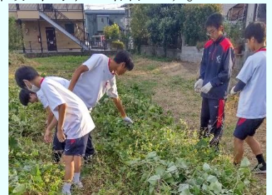
福祉施設の畑でサツマイモを育てる活動