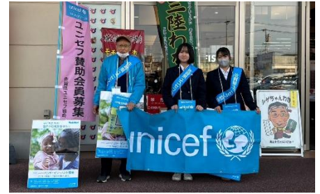
【12月7日(土)コープ新栄店】 募金額 ¥13,935 円