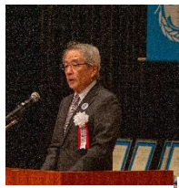
日本ユニセフ協会 早水専務理事挨拶