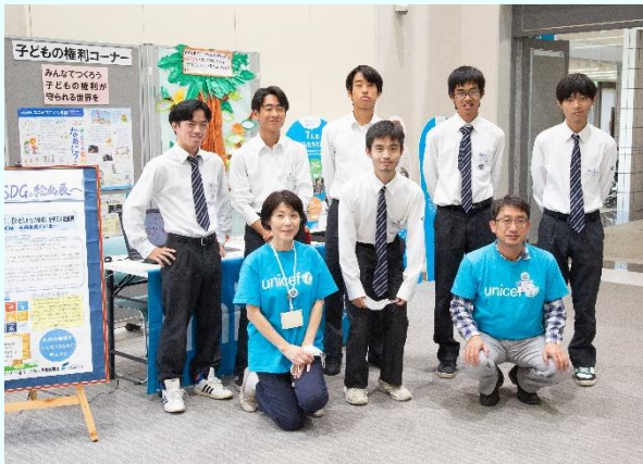
(高志館高校 J R C 部の皆さん)