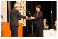
田口電機工業株式会社