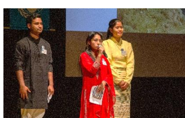
弘堂国際学園(ピアさん、サントシさん、リンさん) 「募金活動体験の発表」