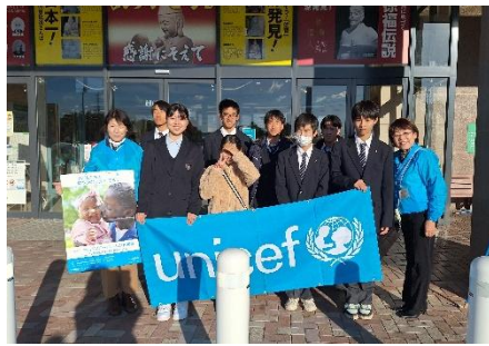
【12月8日(日)イオンモール佐賀大和店】 募金額 ¥27,835 円