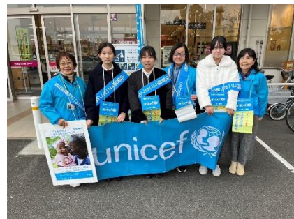
【12月15日(日)ゆめマート佐賀店】 募金額 ¥25,075 円