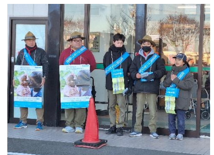
【12月22日(日)ララベル鹿島店】 募金額 ¥27,080 円