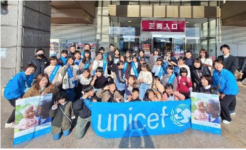
【12月7日(土)ゆめタウン佐賀店 1回目】 募金額 ¥54,477 円