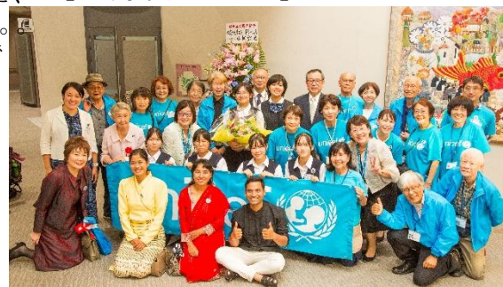
【運営委員やボランティアさん達との集合写真】