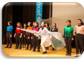
ティーンズミュージカル ジカルSAGA 梁光の架け橋