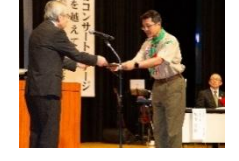
ボーイスカウト佐賀県連盟