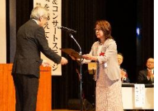
JA佐賀県女性組織 協議会