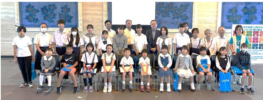
【特別賞受賞者 及び 主催者との集合写真 2024. 9. 29】

2015年、「誰一人取り残さない」という願いの下、国連の150の国や地域の代表が集まって採択された『SDGs = 持続可能な開発目標』は、2030年に目標達成が危機的状況となっています。「佐賀の子どもたちは未来を見ている」のキャッチフレーズで始めた今回の絵画展でも“身近なところからSDGsの目標達成のために一人一人が初めの一步を歩みだそう”というメッセージが絵に表現されています。