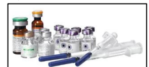
ワクチンスペシャルセット 49人分 1万円